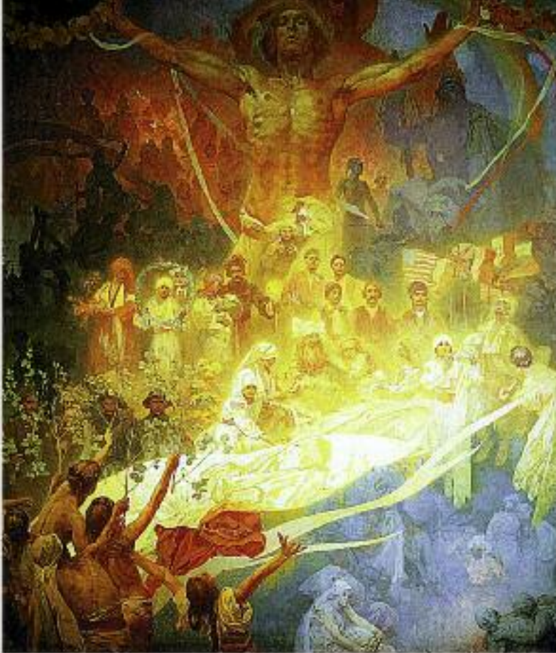
Альфонс Муха. Из цикла «Славянская эпопея». 1926 год

«Русскую идею» концентрированно можно сформулировать как идею солидаризационного развития человечества. Идея солидаризации – это идея коллективизма, но усиленная духовной ориентированностью. Речь идет не просто о коллективе, а о коллективе, одержимом духовными идеалами