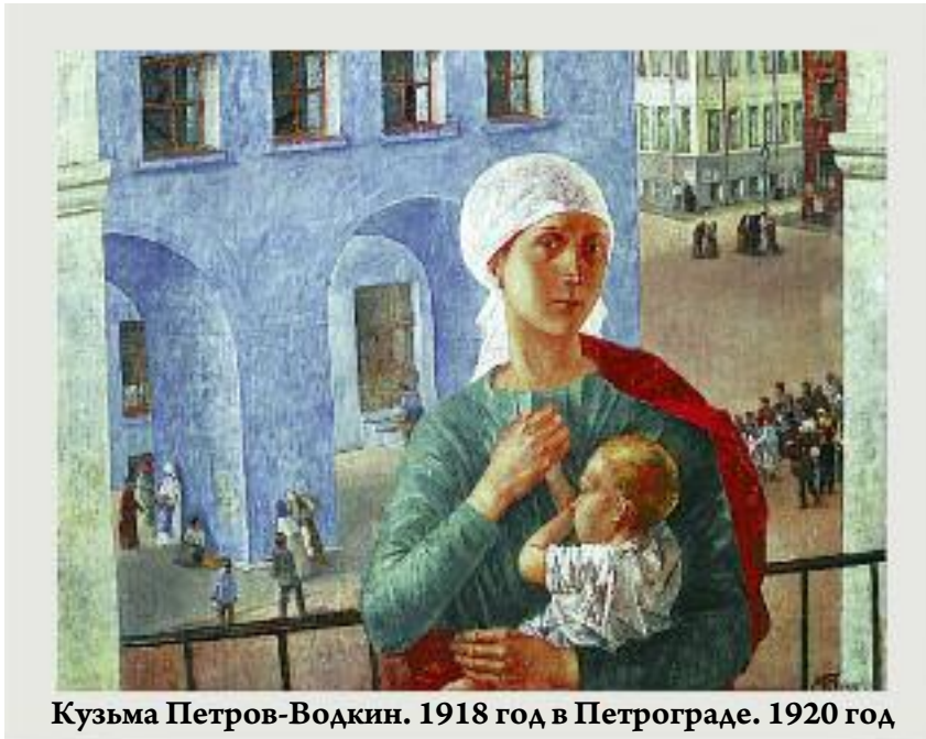
Кузьма Петров-Водкин. 1918 год в Петрограде. 1920 год

«Русская идея» не может быть понята и адекватно воспринята без историософии. Не просто истории, а именно историософии, то есть ценностно-смыслового рассмотрения исторического процесса