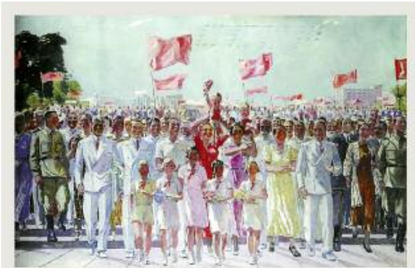
Александр Дейнека. Стахановцы. По Сталинскому пути. 1938 год