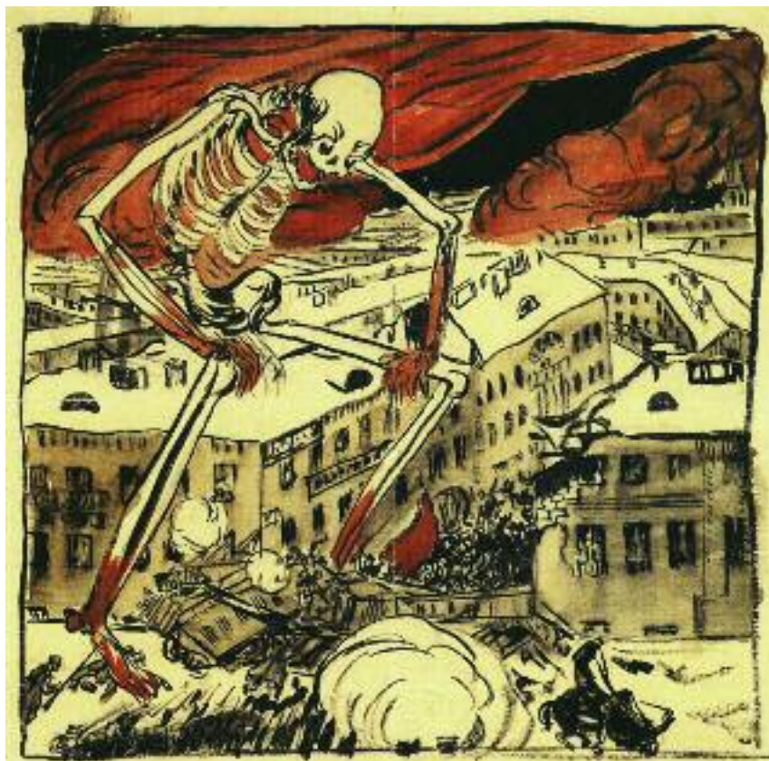
Борис Кустодиев. Вступление. 1905 год. Москва. 2. 1905 год

мунизма в России. Коммунизм идет от раскольников, от самого начала российского государствогенеза. Ленин (в бердяевской трактовке) не столько марксист, сколько народник. Он хотя и клеймил народников с позиций марксизма, исторически выступал выразителем той же народнической линии. Большевизм впитал в себя русские цивилизационно-ценностные традиции и идеалы. В связи с этим приведу лишь одну цитату, в которой Бердяев, как бы обращаясь к Западу, говорит, что тот совершенно не понимает происходящего в