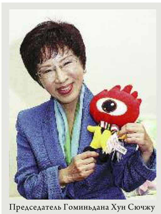
Председатель Гоминьдана Хун Сючжу

Интерес Китая к акватории Тихого океана объясняется уже его неоспоримым положением региональной державы. Этот интерес подогре-