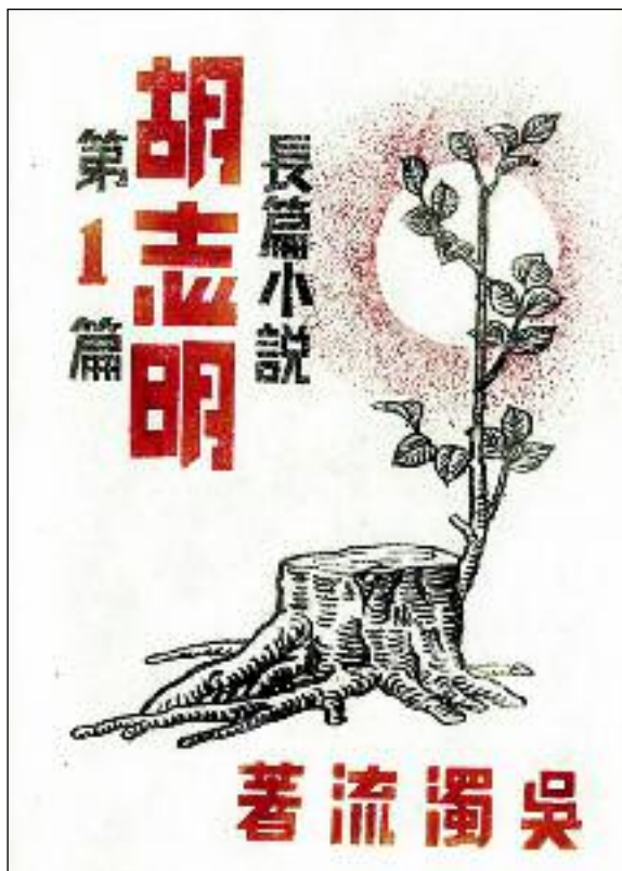
Обложка книги У Чжолю «Сирота Азии»

Подобный расклад, конечно, имеет свою историческую динамику. Приход к власти ДПП в 2000 году был следствием усталости от пассивной позиции Гоминьдана и веры в хорошие перспективы самостоятельности – если не формальной независимости – Тайваня на международной арене. Крах ДПП в 2008 году стал, помимо прочего, результатом явственно обозначившейся экономической бесперспективности курса этой партии. Вернувшийся тогда к власти Гоминьдан использовал возможность развития связей с КНР без ущемления реальной самостоятельности острова (хотя оппозиция не уставала обвинять гоминьдановского президента Ма Инцзю в готовности «продать Тайвань»). Почти исчез страх перед КНР, и это, как ни странно, сыграло на руку ДПП. Последняя вернулась к власти в 2016 году как раз благодаря успехам ее политического противника: новый президент Цай Инвэнь утверждала, что сохранит «отношения доверия» с КНР, не поступаясь суверенитетом Тайваня. Однако, как и полтора десятилетия тому назад, такая позиция не принесла позитивных результатов. «Отношения между двумя сторонами Тайваньского пролива» значительно ухудшились, экономика острова впала в стагна-