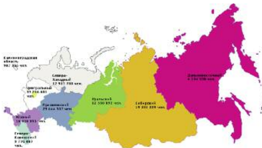
Распределение населения по округам РФ в 2016 году

Однако одной мотивации недостаточно. Становление человека невозможно без таких базовых вещей, как образование, здравоохранение, жилье, безопасная среда, возможность работать и получать адекватную зарплату. Задача государства именно в том, чтобы формировать благоприятную среду, инвестировать в социально значимую инфраструктуру и проявлять реальную заботу о человеке, который, в свою очередь, развиваясь, сможет обеспечить процветание себя и государства в целом. На деле же картина в современной России прямо противоположная: с одной стороны, государство декларирует необходимость воспитания такого человека, с другой стороны, оно готово тратить средства на что угодно, даже на откровенно убыточные предприятия типа олимпийских строек, мостов на остров Русский, «Силу Сибири» и пр. – и при этом говорить о недостатке средств для людей, живущих и содержащих это государство. Всё это ухудшает условия человеческого су-