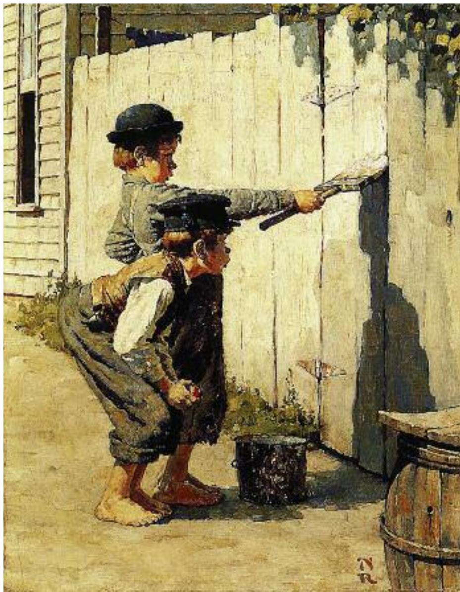
Иллюстрация к «Приключениям Тома Сойера» Марка Твена

Здравоохранение. Число больничных организаций с 2000 года сократилось в 2 раза, поликлиник – в 1,2 раза, станций скорой помощи –