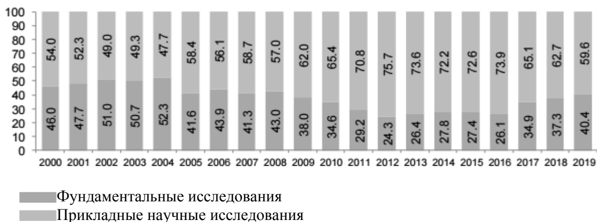
Рис. 4. Ассигнования на гражданскую науку из средств федерального бюджета: распределение на фундаментальные и прикладные научные исследования, %