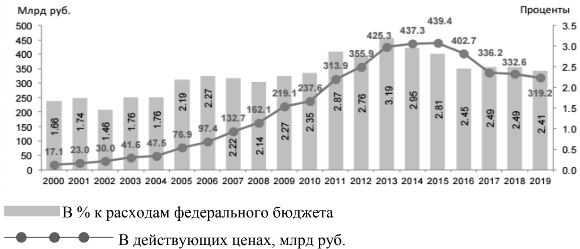
Рис. 3. Ассигнования на гражданскую науку из средств федерального бюджета