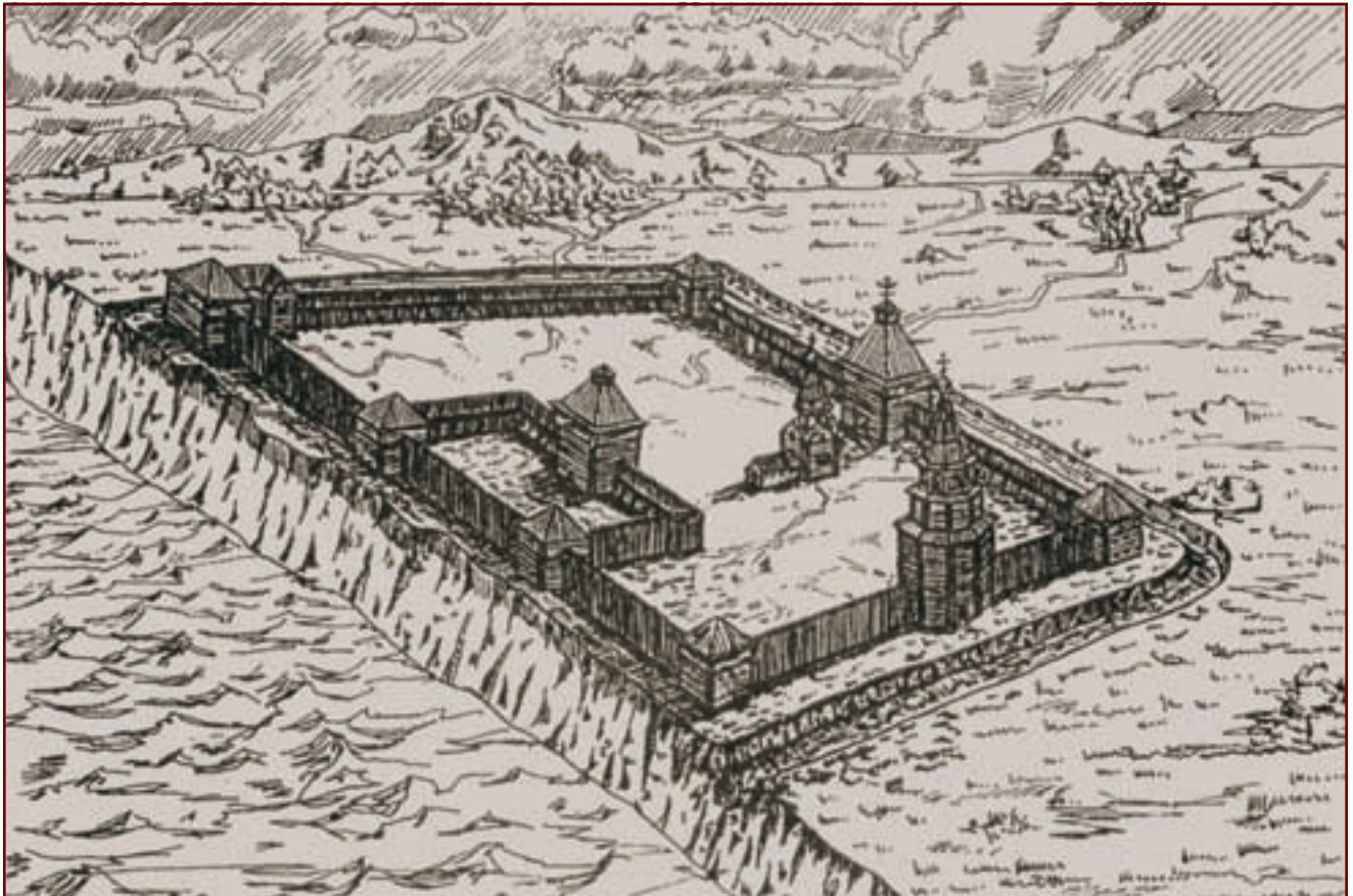
Албазинский острог в 1682—1685 годах. Реконструкция А. Артемьева

кую землю большую рать... Ратным людям нужно взять хлеба из Якутска по 7 пуд на человека на дорогу до волоку, а за волоком на Амуре можно хлеб взять у даурских людей хоть на 20 тысяч или больше...»