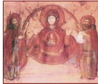
Знамя Албазинского острога