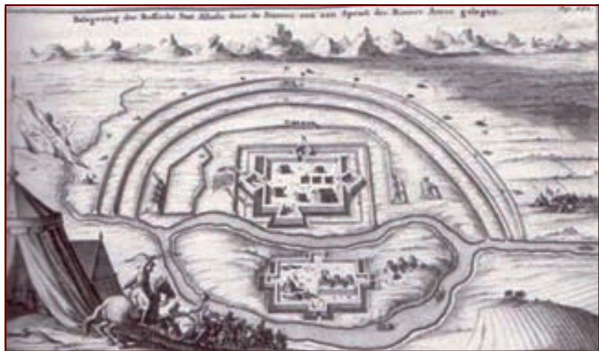
Албазинский острог. Осада крепости маньчжурами в 1686—1687 годах. Рисунок из книги Н. Витсена, 1692 год

11 числа начальник китайского отряда послал в крепость письмо, написанное на трех языках: по-русски, по-маньчжурски и по латыни — китайцы знали, что в крепости могут быть европейские наемники русского царя. Генерал предлагал сдаться на почетных условиях. Воевода не отвечал. В крепости вместе с крестьянами и семья-