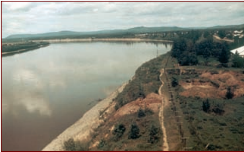
Северо-западная часть Албазинского острога. Раскопки А. Артемьева на месте, где находилась полуземлянка (1992 год)

В апреле ситуация стала ужасающей: цитадель была завалена трупами, хоронить которые не было сил. Бейтон на костылях едва взбирался на стены, но командовал властно и решительно: никакой сдачи, держаться до последнего человека.