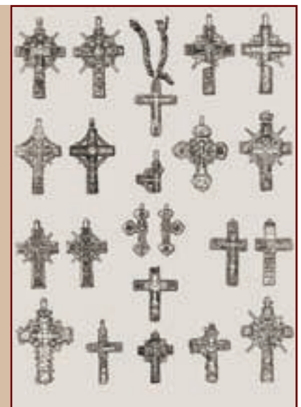
Полуземлянка с останками непогребенных в 1686—1687 годах защитников острога и нательные кресты, найденные при раскопках