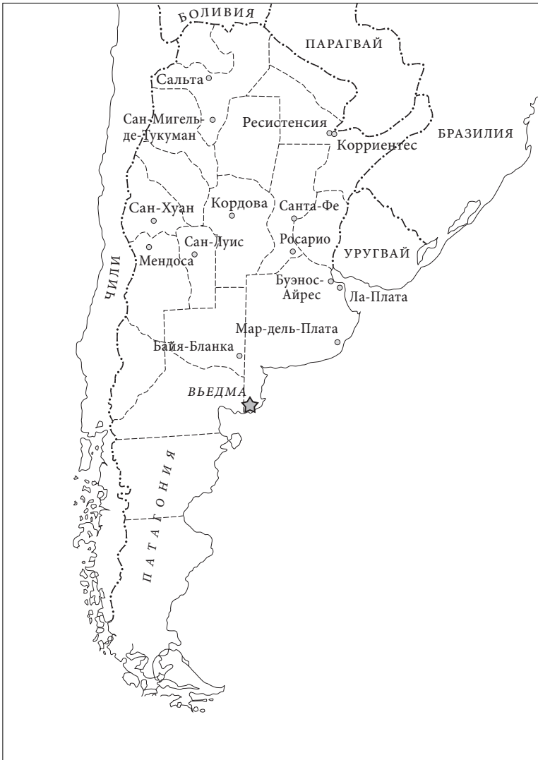
РИС. 1. Аргентина: расположение новой столицы

наиболее важных госслужащих из Буэнос-Айреса и превратить их в бюрократическую элиту, которая бы управляла страной из Вьедмы. Залогом ее эффективности будет именно перемещение госслужащих из их нынешней среды.