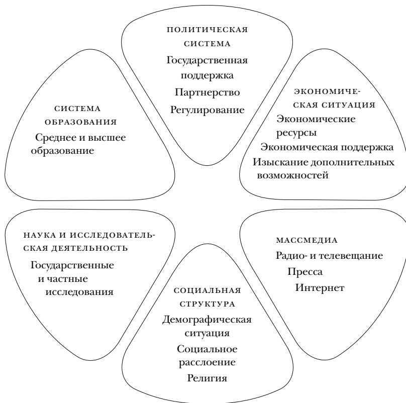
Рис. 1. Ресурсы на уровне «Общество» (Digel 2001: 246)

сти немалое число различий между категориями, каждая из которых бывает значима для успеха на международных соревнованиях. Сюда относятся, скажем, поиск и подготовка талантов, профессиональная подготовка и умения тренера, периодичность соревнований, организационные структуры и их персонал и не в последнюю очередь — размеры и структура финансирования (рис. 2).