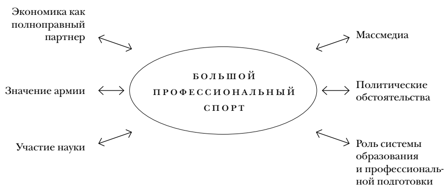
Рис. 3. Ресурсы «Совокупности обстоятельств» (Digel 2001: 247–248)

социальные факторы предопределили именно такой путь распространения спорта в данной стране. Но сначала нужно сказать о преимуществах и рисках такого сравнения наций и культур.