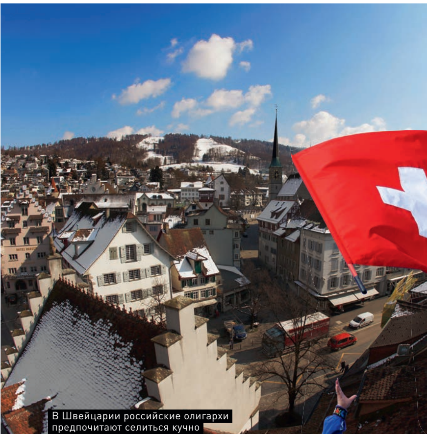
В Швейцарии российские олигархи предпочитают селиться кучно

Грандиозные и безвкусные дворцы а-ля Версаль, уродующие своим видом побережье озер, раздражают местных жителей. Недавно власти Берна объявили о своих планах выставить на продажу несколько старинных замков. Однако решение вызвало недовольство у швейцарцев, ценящих традиционный уклад. «Людей беспокоит то, что замки могут купить российские олигархи, которые не поймут ни исторического значения этих сооружений, ни традиционных швейцарских ценностей», — объясняла журналистам Моника