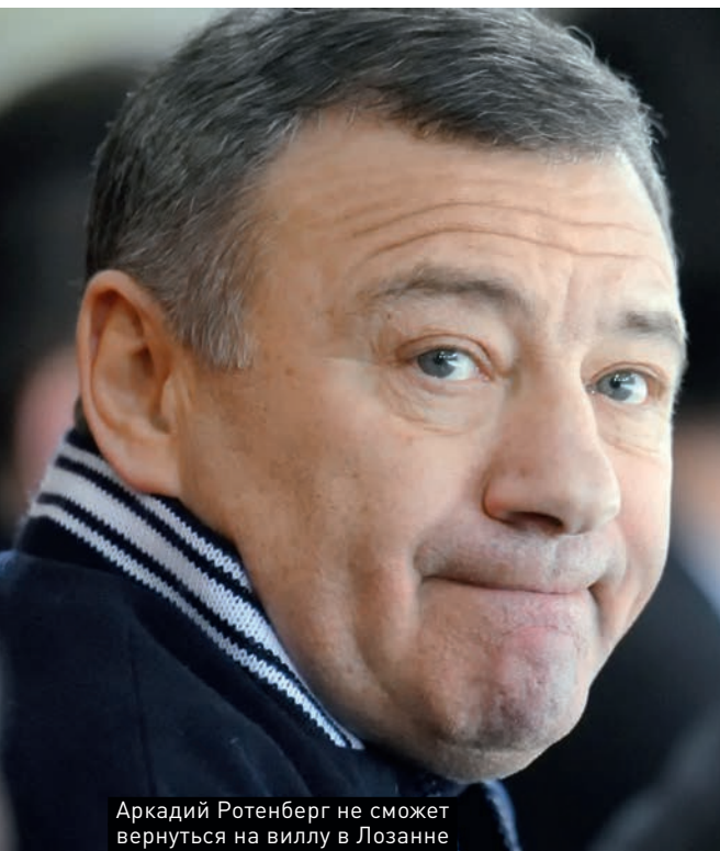
Аркадий Ротенберг не сможет вернуться на виллу в Лозанне

В числе приближенных Кремлю олигархов, обитающих в Швейцарии, в первую очередь называют Геннадия Тимченко ($14,1 млрд). В марте США внесли Тимченко в свой список невыездных лиц как «члена внутреннего круга» Путина. По мнению американцев, Путин имеет непосредственное отношение к деятельности принадлежащей Тимченко компании Gunvor, экспортирующей на Запад российскую нефть. Компания это отрицает. Впрочем, никто не может отрицать, что политическая карьера Путина и рост благосостояния его давнего приятеля шли параллельно.