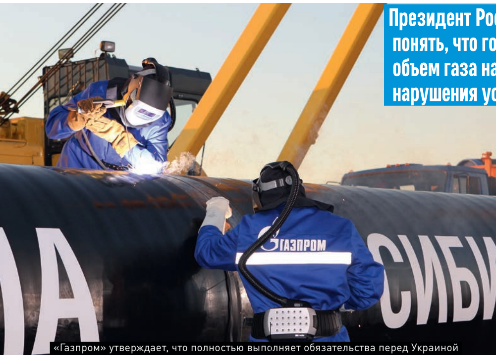
«Газпром» утверждает, что полностью выполняет обязательства перед Украиной