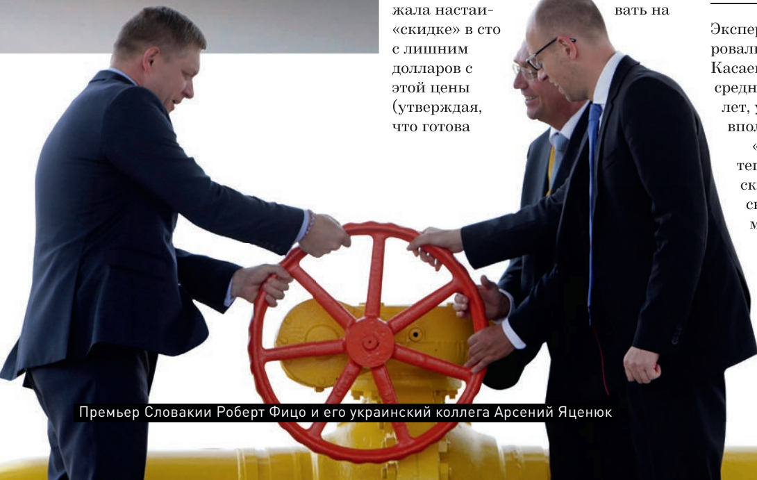
Премьер Словакии Роберт Фицо и его украинский коллега Арсений Яценюк