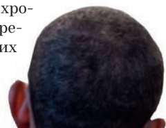
THE PRESIDENT JANUARY 20, 2009

Практически каждый президент США, вне зависимости от политических успехов и эффективности экономических решений, уходит с багажом упреков за спиной. Они необязательно должны быть справедливыми, но для стабильности американской политической системы необходимо, чтобы электорат был уверен: все ошибки,