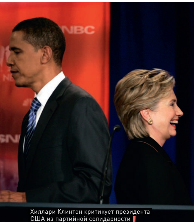
Хиллари Клинтон критикует президента США из партийной солидарности

Евсеев. — Дело в том, что козырей у критиков Обамы действительно много, США при нем допустили большое количество просчетов».