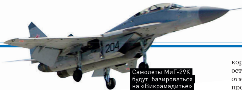
Самолеты МиГ-29К будут базироваться на «Викрамадитье»

Сделка по передаче авианосца «Викрамадитья» индийским ВМС демонстрирует: Россия остается мировым центром судостроения. Для нашего сотрудничества с Индией выполнение этого трудного контракта крайне важно. Возможность реализации нашего оборонно-промышленного комплекса позволяет в перспективе рассчитывать на то, что мы сохраним свои позиции на индийском рынке. Объединенная судостроительная корпорация выполнила заключенный контракт с высоким качеством. Фактически Индия получила абсолютно новый авианосец. От старого остался только корпус. Это еще раз показывает, что потенциал у России есть, и мы будем продолжать наращивать экспортные возможности по морскому сегменту вооружения. Мы ожидаем, что после этого контракта последуют новые.