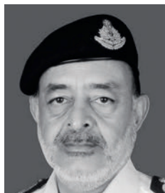
Девендра Кумар Джоши, глава ВМФ Индии

«Викрамадитья» станет промежуточным звеном между нынешним авианосцем ВМФ Индии «Вираат» и строящимся в данный момент индийским авианосцем «Викрант». Кроме того, приобретением российского авианосца мы достигаем другой цели: управлять двумя авианосцами одновременно.