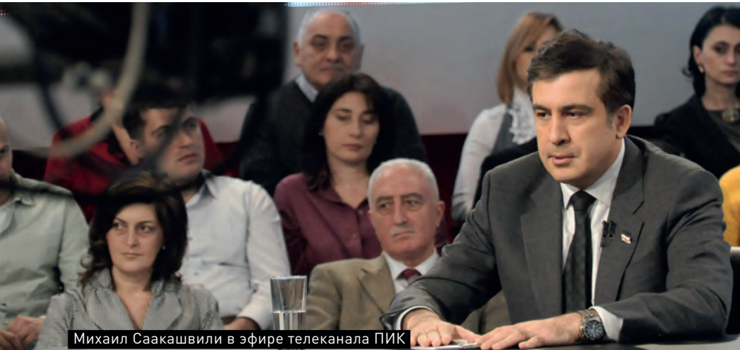
Михаил Саакашвили в эфире телеканала ПИК

В сверхполитизированной Грузии вечернее время на телевидении — на вес золота. Каждый день в «прайм-тайм» телекомпании борются за своего зрителя. И тем удивительнее на первый взгляд выбор канала «TV3», принадлежащего группе бизнесменов, которые старательно демонстрируют свою непредвзятость в подаче информации. В 22 часа начинается программа «Итоги» на русском языке.