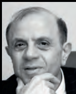
ЛЕВАН БЕРДЗЕНИШВИЛИ, депутат от коалиции «Грузинская мечта» (Республиканская партия):