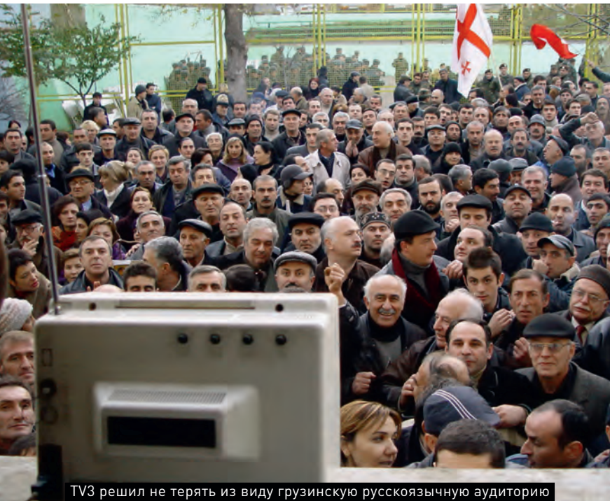
TV3 решил не терять из виду грузинскую русскоязычную аудиторию