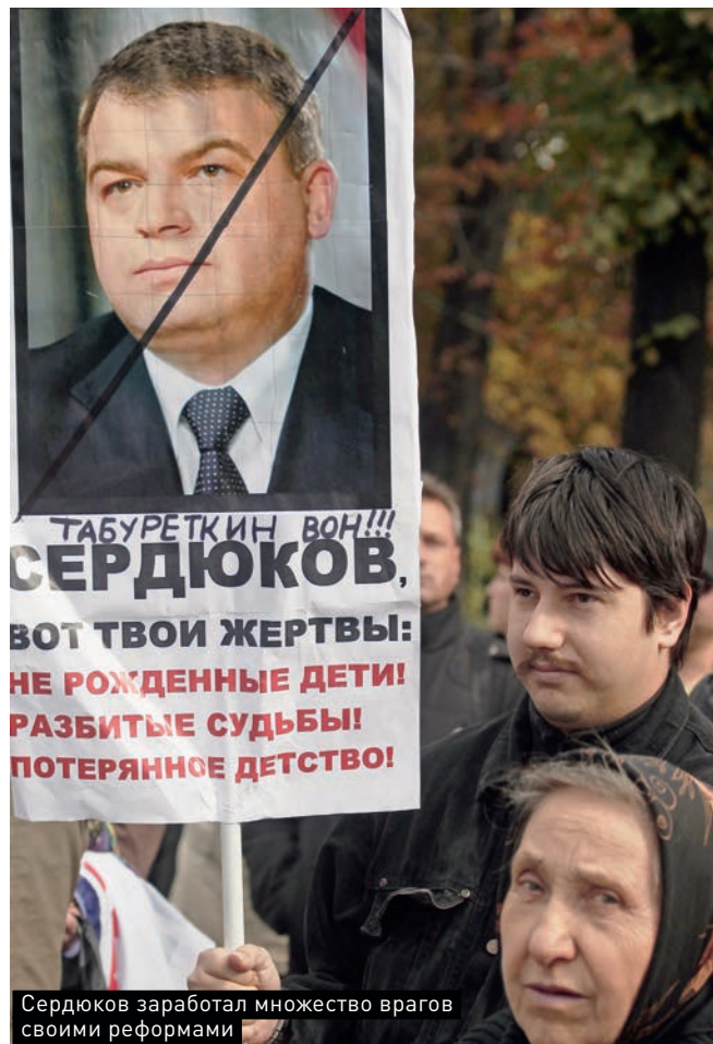
Сердюков заработал множество врагов своими реформами

При этом те же самые факторы, благодаря которым реформа удалась, привели и к серьезным ошибкам. В первую очередь полемика