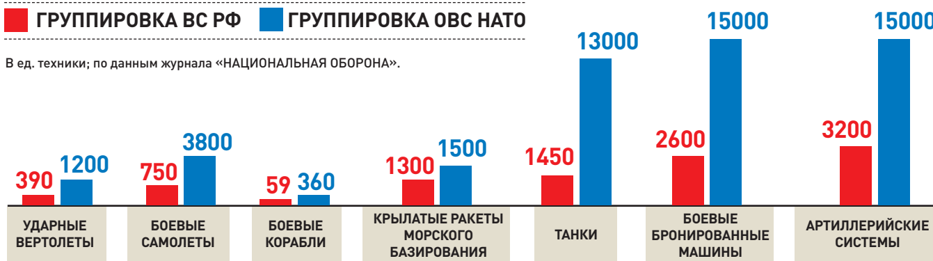
В ед. техники; по данным журнала «НАЦИОНАЛЬНАЯ ОБОРОНА».

ны многие популярные военачальники, благодаря чему в ней изменился моральный климат. В обществе сложилось абсолютно новое восприятие армии, Вооруженным силам доверяет огромное количество людей.