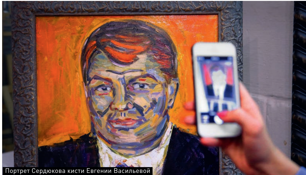
Портрет Сердюкова кисти Евгении Васильевой

В 2008 году во время защиты Южной Осетии от грузинской агрессии российская армия впервые после Афганской войны вступила в бой с вооруженными силами другого государства. Несмотря на тактический успех, боевая операция выявила огромное количество проблем в самой армии — неповоротливость, отсутствие связи, устаревшее вооружение и способы управления, а главное, отсутствие конкурентного преимущества по сравнению с натовскими частями. Поэтому через месяц после завершения активной фазы операции Минобороны запустило масштабную реформу Вооруженных сил. Возглавил реформу Анатолий Сердюков — бизнесмен и налоговик, которого до назначения на пост министра обороны