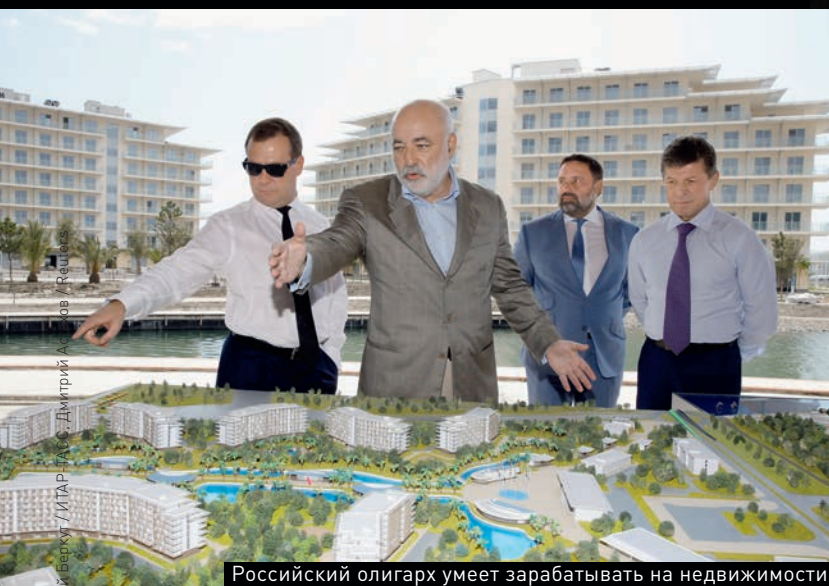
Российский олигарх умеет зарабатывать на недвижимости