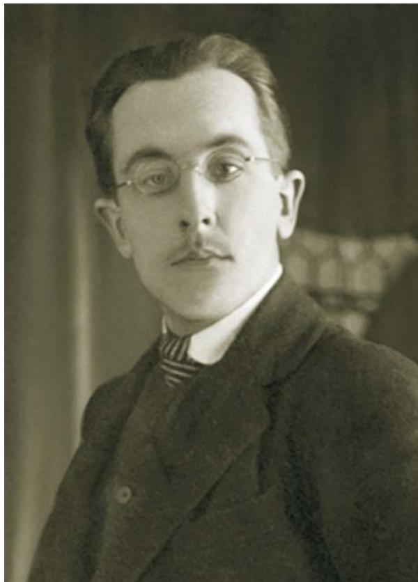
Карл Карлович Балод (Баллод)

В марте 1919 г. во время красного террора по решению комиссии по охране порядка Я.Л. Мовшензон был расстрелян вместе с 76-ю другими горожанами по обвинению в попытке политического переворота. В 20-е годы на еврейском кладбище Якову Мовшензону был сооружен большой надгробный памятник из черного карельского гранита, снесенный впоследствии при ликвидации еврейского кладбища.