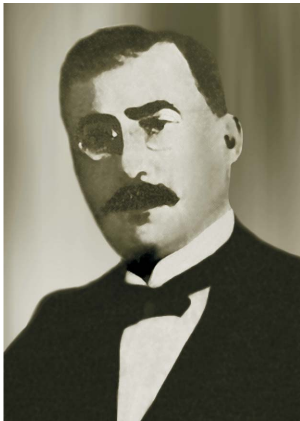
Яков Львович Мовшензон

По мнению многих исследователей, двинское самоуправление конца 1918 г. было первым демократическим органом власти в городе.