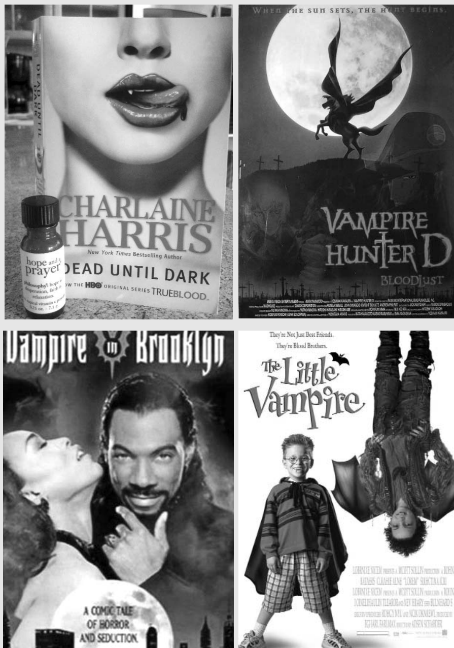
Обложки книг и упаковки видеокассет, 2010-е годы.

захватывает и молодежь, ее наиболее активную часть, которая, живя в большой нужде, одновременно учится и ведет общественную работу, часто с той же подавляющей нагрузкой. <... > Разные формы “советской изношенности” представляют результат несоответствия между индивидуальными силами организма и тяжестью жизненных задач, которые он вынужден решать в данной социально-хозяйственной обстановке. Что может быть, в таком случае, реально действенное, чем выход за пределы индивидуальных сил организма, их пополнение живыми активностями в другом организме 14 . Та же тональность слышна и в книге «Борьба за жизнеспособность»: «Как бы ни было незначительно или частично в каждом отдельном случае это расширение базы жизни, оно может разворачиваться и путем повторных актов кровной конъюгации накапливаться дальше и дальше до границ, которые заранее предвидеть нельзя» 15 .