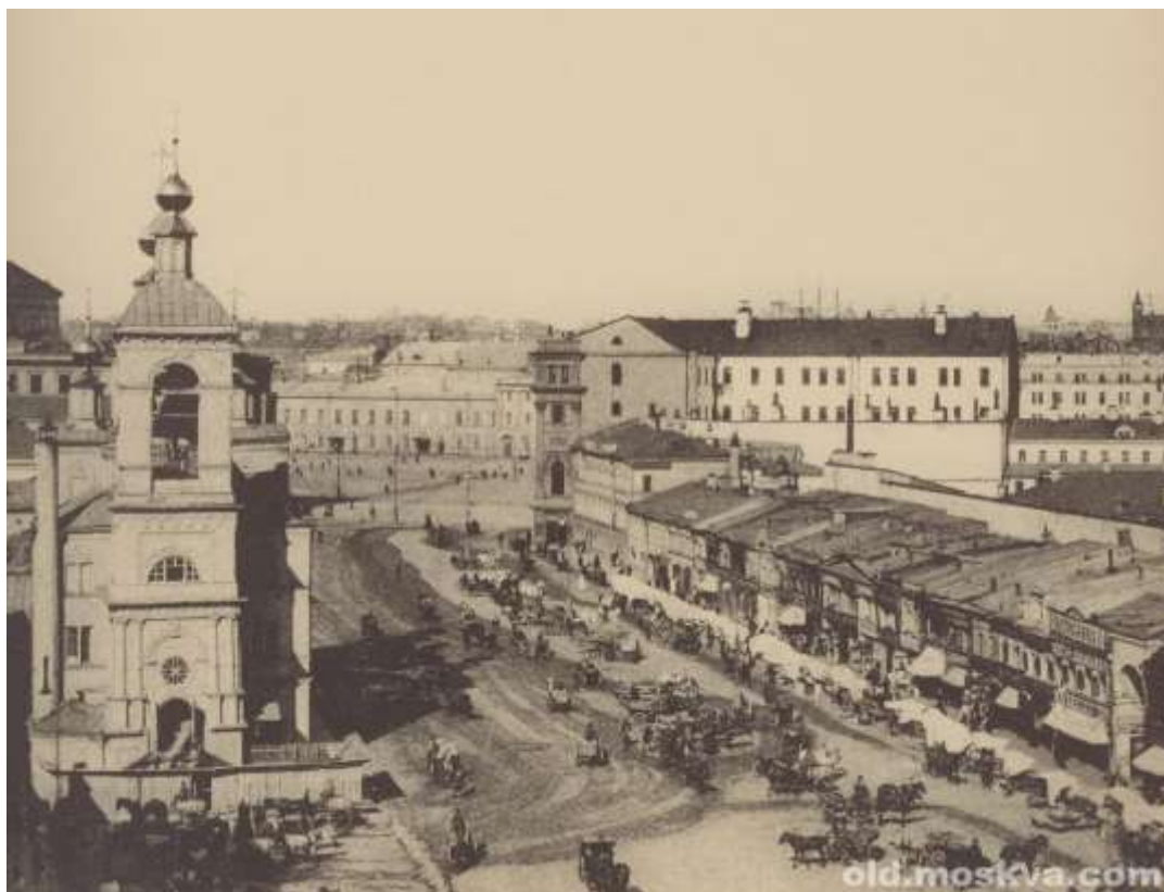
Рисунок 2. Охотный ряд и Манежная площадь в середине 1930-х гг. 11