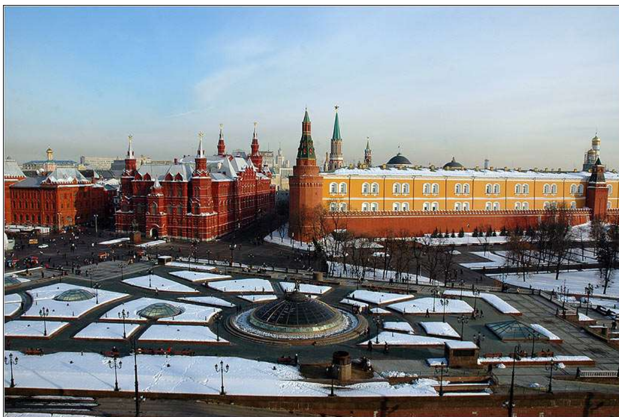
Рисунок 6. Манежная площадь в наши дни 24

Рассказы архитекторов, которые следовало бы анализировать куда более подробно, позволяют даже в кратком, сухом изложении обнаружить определенную идею места . Попробуем