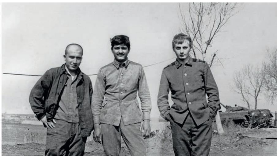
Автор с сослуживцами из Азербайджана и Таджикистана. Волгоградская область, полигон Прудбой, 1988 г.

Я мастер низких ожиданий... Я не аналитический человек. Я не трачу много времени, думая о себе, думая о том, почему я делаю то, что я делаю.