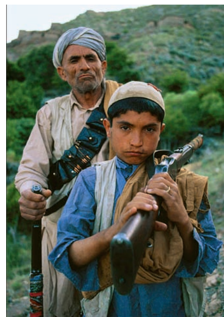
Вооруженные афганские крестьяне или «мировые террористы»?

Так изначально инструментальное понятие из ряда таких же понятий классического рационального «дискурса модерна» становится «понятием-монстром» и подчиняет себе социальную и смысловую реальность. И разумеется, дело интеллектуалов — не участвовать в таком «бесконечном воспроизведении» данного явления, а качественно и рационально его проблематизировать, объяснять, расшифровывать и тем самым — «снимать». Вот дейст-