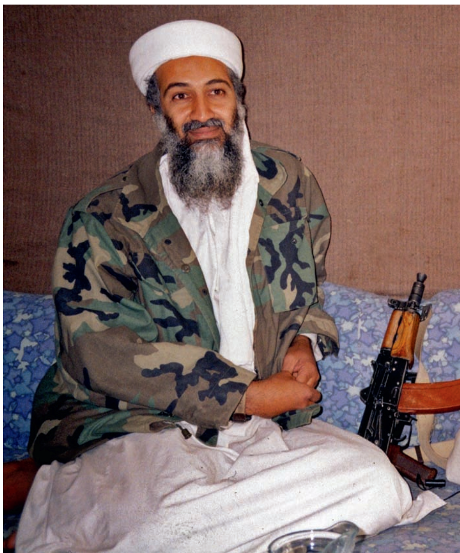
Усама бин Ладен — один из самых опасных и разыскиваемых террористов по версии Государственного департамента США

Такая логическая цепочка, как мы еще прекрасно помним, была в принципе недопустима и абсурдна не только в советской школе, в контексте советской науки, но и вообще в контексте действующую