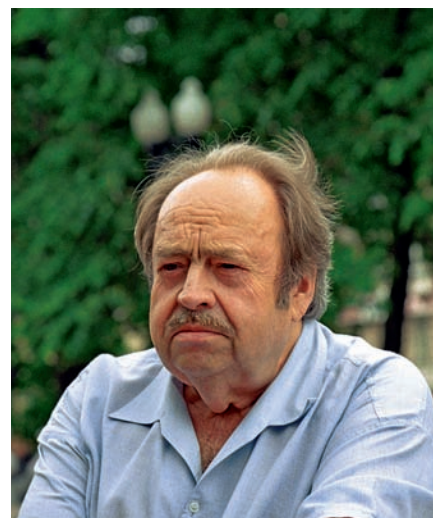
Бовин Александр Евгеньевич — советский и российский журналист, публицист, политолог, дипломат

Таким образом, в СССР в плане формирования политического сознания, как массового, так и принимающего решения, явно имела место некая система, организация усилий отдельных людей и целых институтов, направленная на расшифровку, анализ, истолкование различных фактов, событий, подготовку и принятие решений. Причем эта система была построена таким образом, что