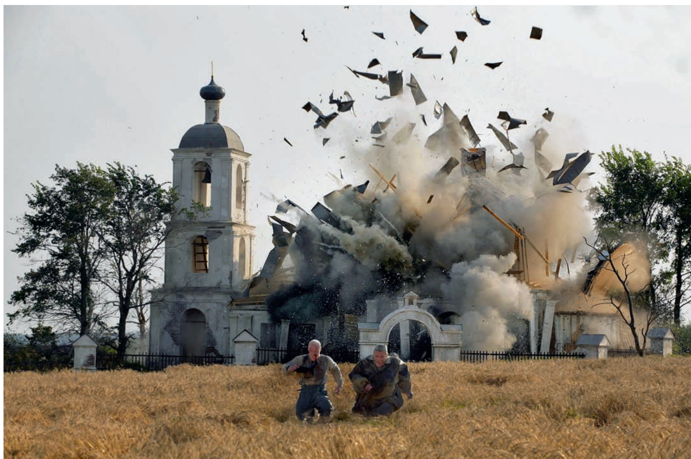
Утомленные солнцем 2: Предстояние. Кадр из фильма