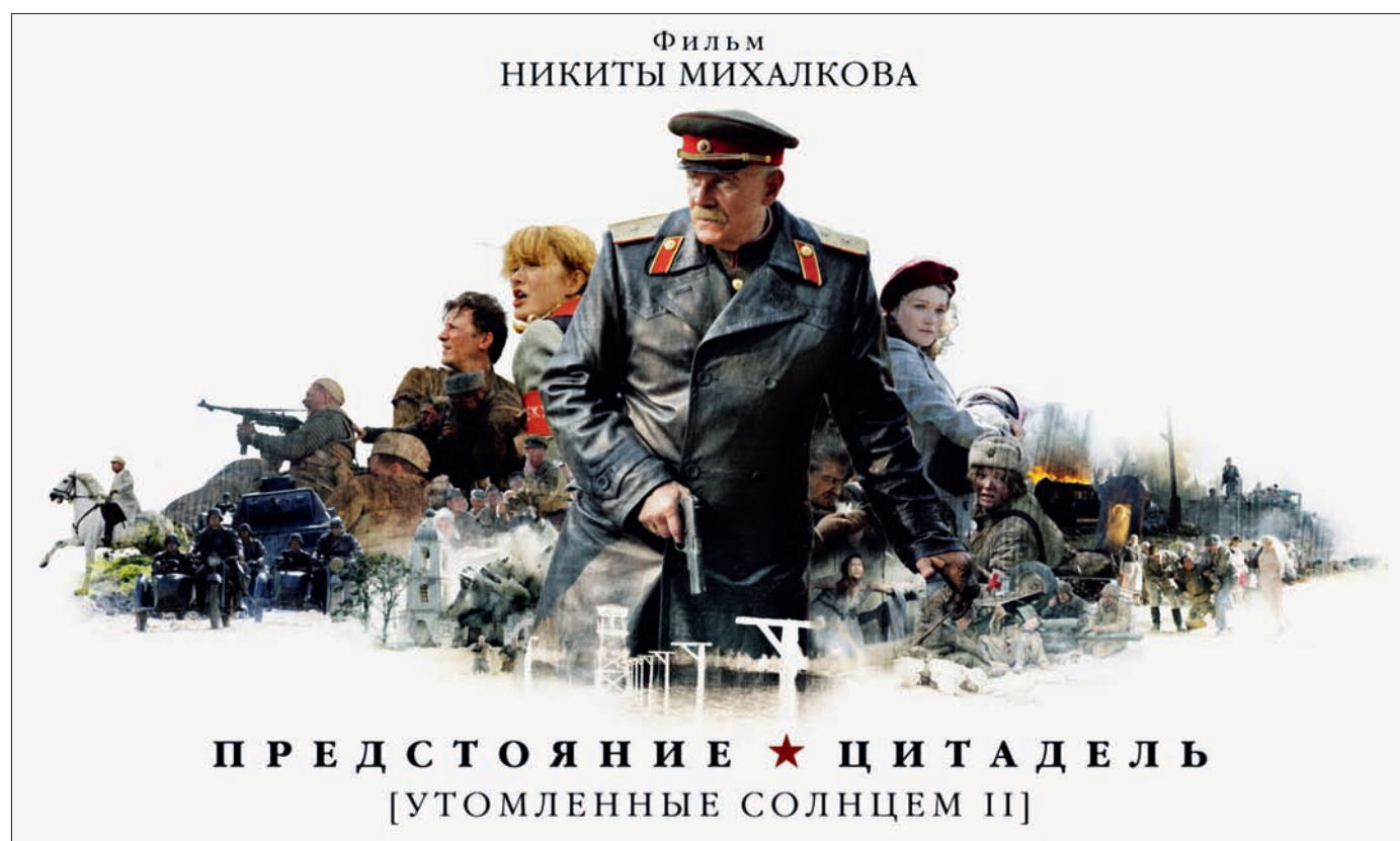
Афиша дилогии «Утомленные солнцем 2». Реж. Никита Михалков

уже проговорился: бывший комдив Котов в рядах штрафников ведет 15 тысяч невооруженных человек на штурм крепости. Такую невыполнимую задачу, каким-то непонятным образом, формулирует герою сам Сталин. Но Котов неожиданно принимает другое решение — идти на смерть одному, мотивируя поступок следующими словами: «Ты — миллионами руководишь, и мной в том числе, но собой лично руковожу я, поэтому буду поступать, как считаю нужным, не с другими, а с собой!» Здесь все, как обычно у Михалкова, низводится до индивидуального выбора, несовместимого с духом коллективизма. В итоге бывший нарком совершает подвиг. После победы в бою приезжает старый знакомый — энкавэдэшник дядя Митяй, который арестовывал Котова в 1936-м. Митяй вручает бывшему комдиву его ордена, которые были привезены из Москвы в загадочном планшете по личному приказу Сталина. Таким образом, у Михалкова получается такое видение истории, согласно которому Сталин признал роль репрессирован-