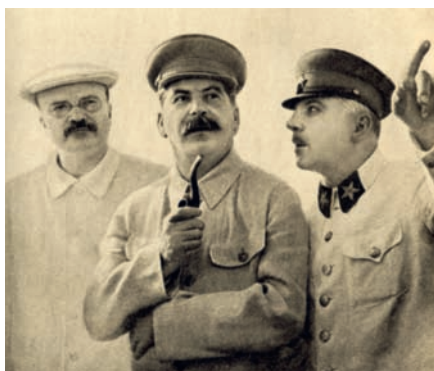
Молотов, Сталин и Ворошилов на центральном аэродроме имени Фрунзе в Москве 25 июня 1937 г.

сталиноненавистников. В одном из недавних публичных высказываний, сделанном в ходе ответов на телефонные звонки граждан в прямом эфире, премьер-министр сказал следующее: «Нельзя, на мой взгляд, давать оценки в целом. Очевидно, что с 1924 по 1953 год страна — а страной тогда руководил Сталин — изменилась коренным образом: она из аграрной превратилась в индустриальную... Мы выиграли Великую Отечественную войну. Кто бы и что