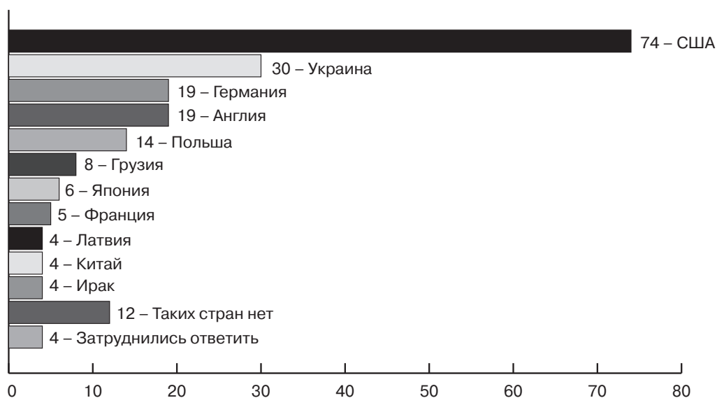
Рисунок 3. Перечень стран, недружественно настроенных к России, по оценкам россиян, в процентах

(открытый вопрос, приведены страны, которые назвали более 4 процентов респондентов)