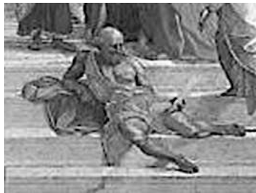
Диоген. Фрагмент картины

Диоген говорил, что когда он видит правителей, врачей или философов, то ему кажется, будто человек – самое разумное из живых существ, но когда он встречает снотолкователей, прорицателей или людей, которые им верят, а также тех, кто чванится славой или богатством, то ему кажется, будто ничего не может быть глупее человека.