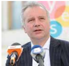
АЛЕКСАНДР РАР – политолог, директор программ России и стран СНГ в Германском совете по внешней политике