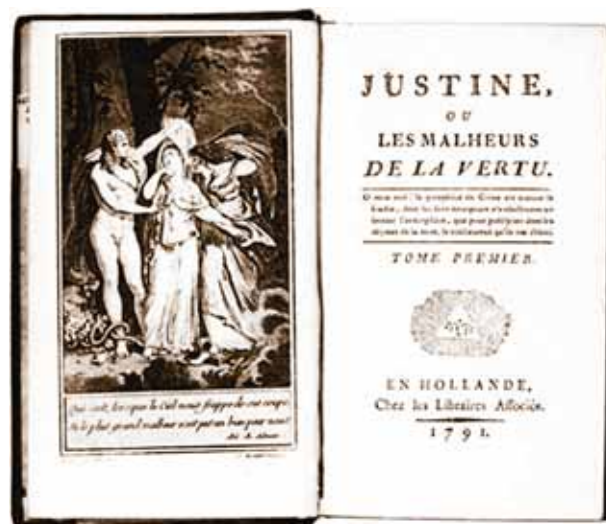
На фото: Прижизненное издание романа «Жюстина, или несчастья добродетели» (1791)

И разве всего этого не достаточно для того, чтобы ты, читатель, усомнился в своих несправедливых обвинениях касательно извращённости уважаемого де Сада? Я приведу ещё один пример его глубочайшей моральности, а также энциклопедического склада ума и личности. Возьмём его роман «Жюстина» и оставим в стороне будущие подробности. В данной книге де Сад, возможно наиболее ярко из всех его трудов, демонстрирует точку