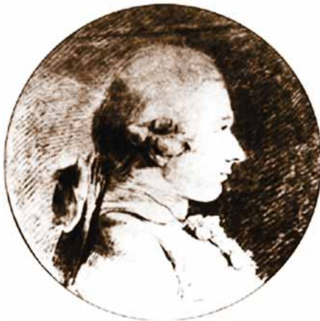
На фото: Ван Лу. Портрет Донасьена Альфонса Франсуа, графа де Сада

Маркиз воистину был личностью незаурядной, чем при жизни ещё вызывал по крайней мере недопонимание своего окружения, закончившиеся тем, что его малодушно заключили сперва в тюрьму, а затем и в пансион для душевнобольных. Но давайте вспомним, что это вообще была за эпоха. Донасьен Альфонс Франсуа де Сад родился в 1740, умер в 1814 году. Как вы помните, это времена смутные не только в истории Франции. Борьба за свободу не только личности, но и положения в социуме; борьба против бедности, ханжества и разврата — дух революции